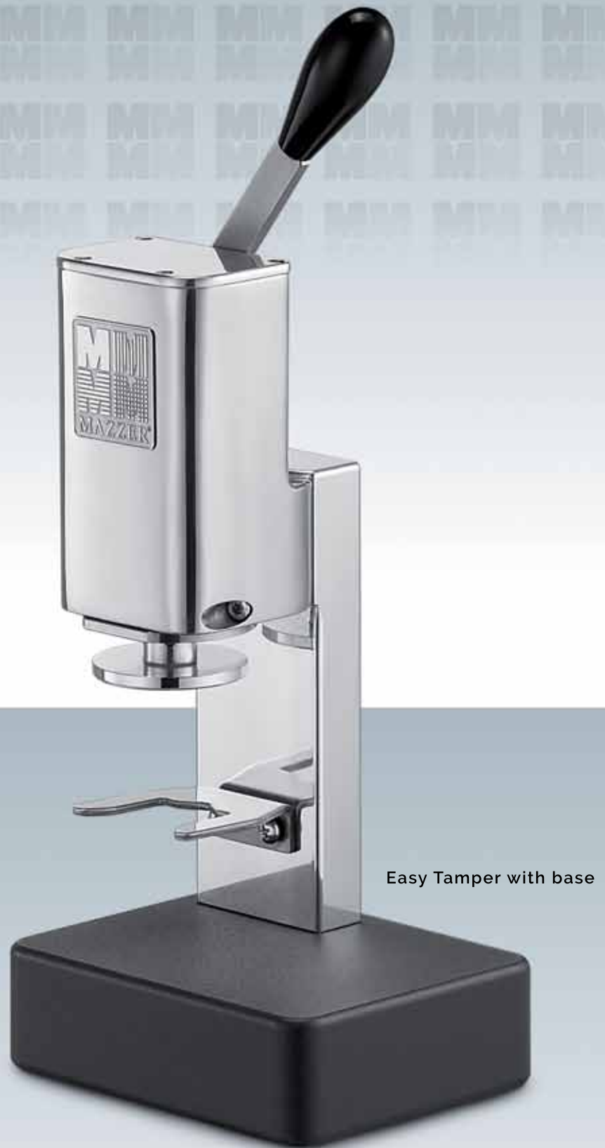
Easy Tamper with base