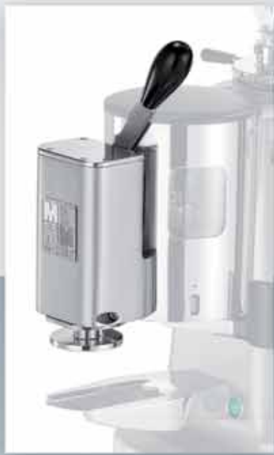
Easy Tamper for doser